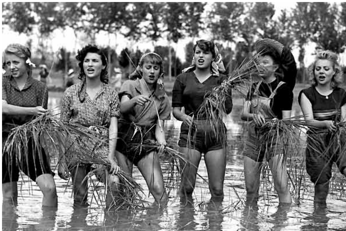
« Riso amaro », ouvrières dans les rizières de la plaine du Pô

Animation Monique Sélim /O.Douville / M.Bonnet. Salle 242, n° 54 boulevard Raspail.